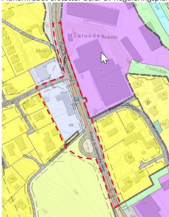
Figur 4: Viser gjeldende reguleringsplan for området.

Planområdet erstatter deler av Reguleringsplan for Vingrom datert 28.05.1980 «Planid:069»