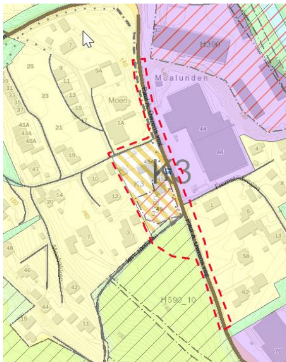
Figur 3: Viser gjeldende kommuneplan for området

Gjeldende kommuneplan for området trådte i kraft den 26.03.2020. Ønsket regulering samsvarer med gjeldende formål angitt i kommuneplanens arealdel som tillater kombinerte bebyggelses og anleggsformål.