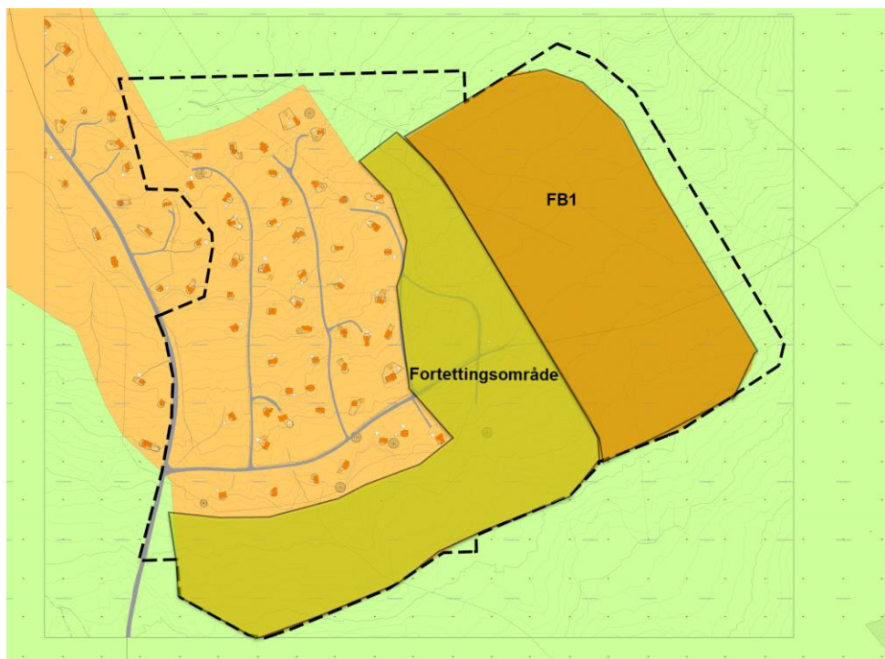
Figur 1: Illustrert planlagt «utbyggingsområde FB1» og «fortettingsområde».