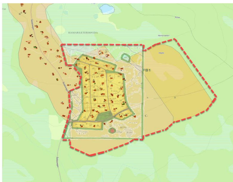
Figur 4: Utsnitt av reguleringsplaner i området.