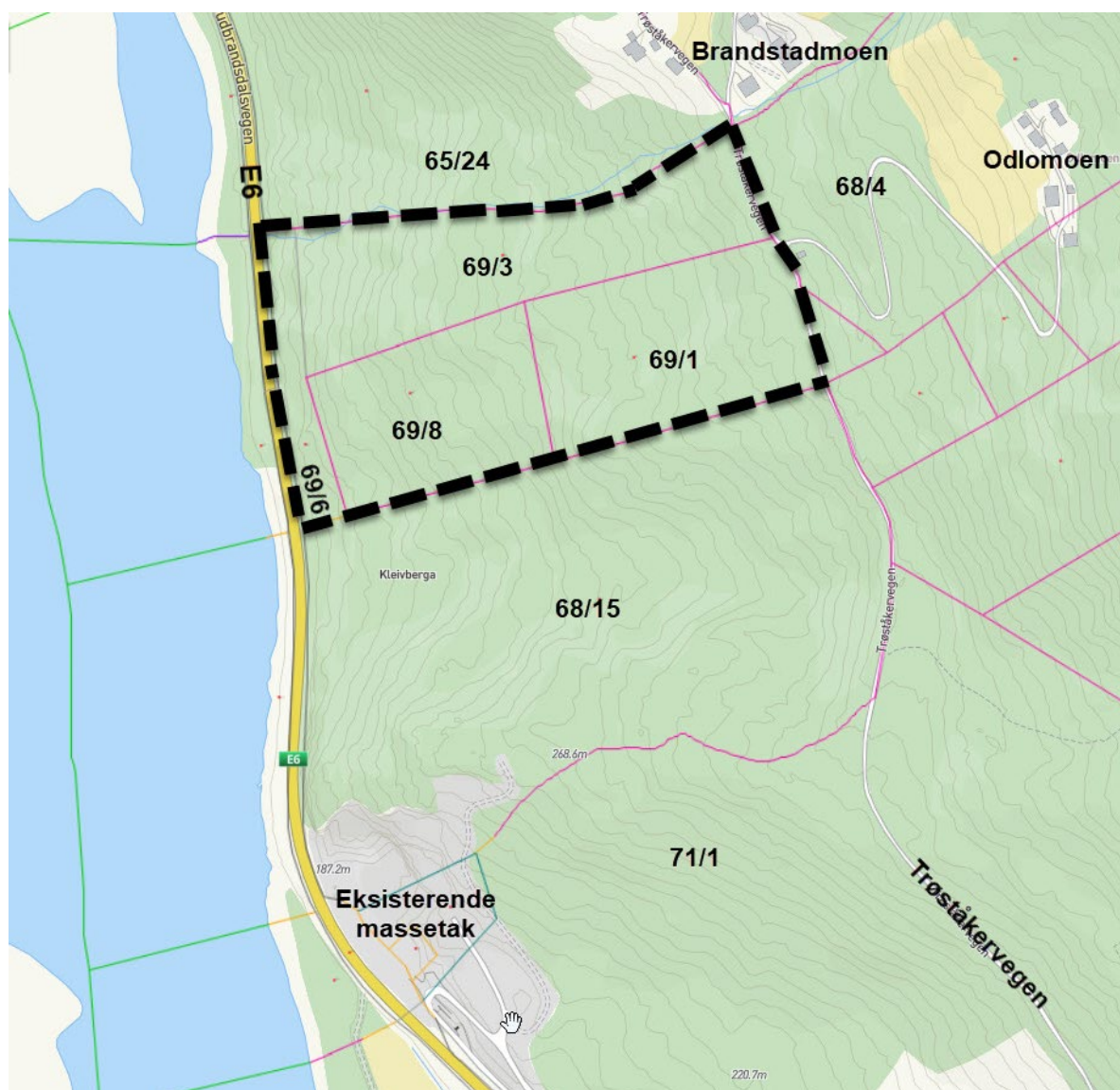
Kart med forslag til plangrense (Kart fra kommunens kartløsning)

Planavgrensningen for Kleivberga Nord tilsvarer område R1.2 avsatt til råstoffutvinning i kommuneplanens arealdel. I tillegg er det tatt med noe areal mot pilegrimsled/Trøståkervegen - øst for uttaksområdet. Mot nord er planområdet avgrenset mot 65/24 og i sør mot eiendom 68/15 og plangrense for Detaljregulering av Kleivberga . Mot vest er planområdet avgrenset av senterlinje i dagens E6.