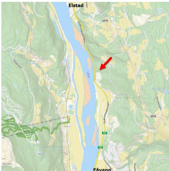
Planområdets beliggenhet markert i oversiktskart

Planområdet ligger langs E6 i Ringebu kommune, ca. 4 km nord for Fåvang.