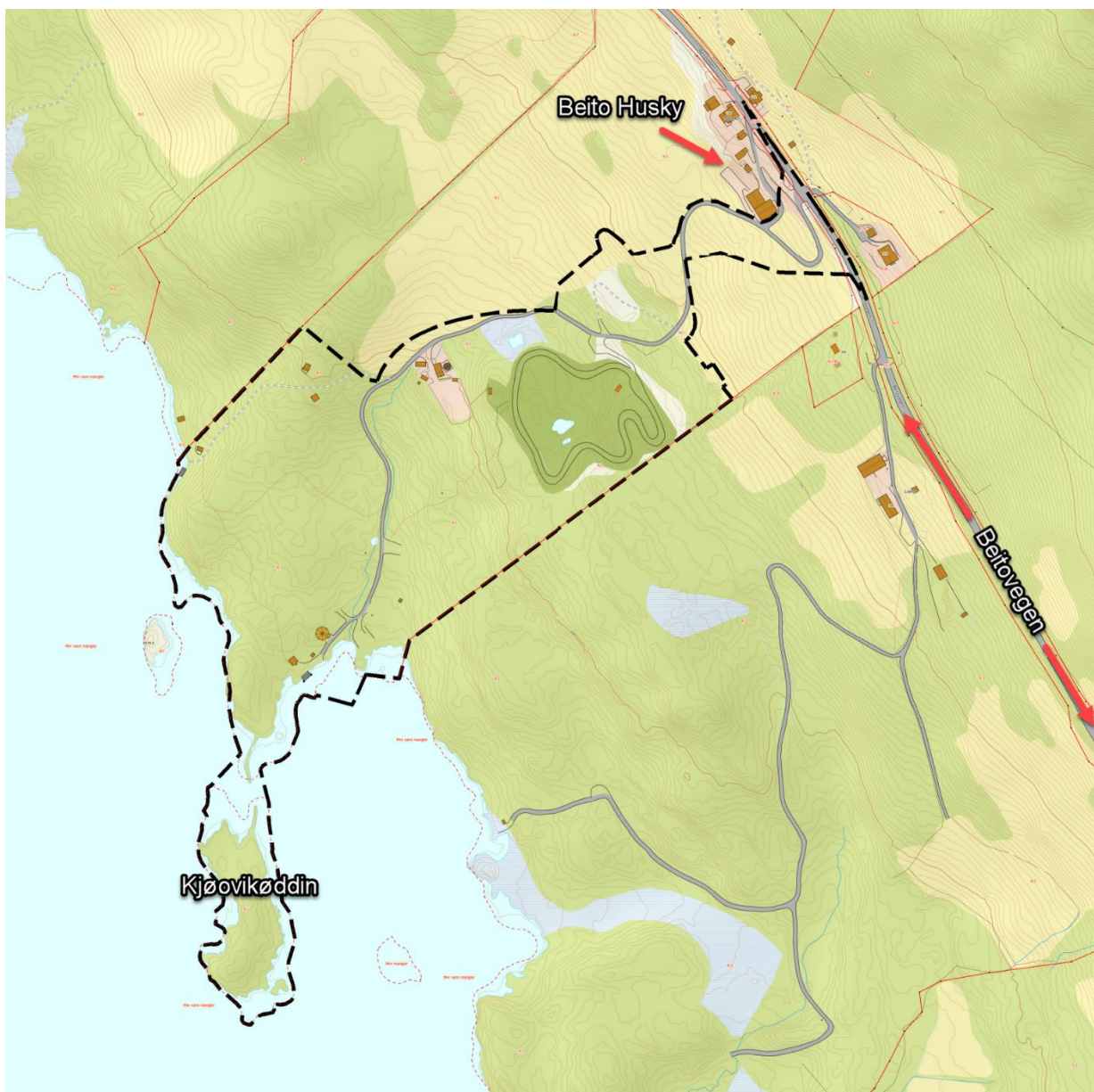
Figur 1: Planavgrensning vist med sort stiplet strek.

Planområdet er på ca. 115 daa og består i dag av en motorcrossbane, klatrepark, Beito husky Tours, ubebygde skogarealer og strandsone.