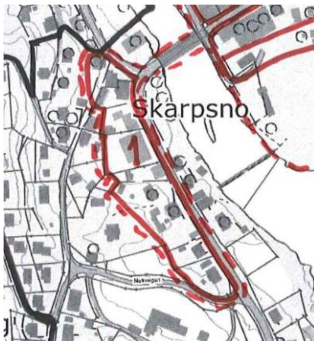
Figur 2: "Skarpsnokvartalet" i kommuneplanen.

Planområdet omfatter deler av reguleringsplan for «E16 Elvegoto – Gamlevegen, fortau», vedtatt 3.5.12, og «Fagernes sentrum», vedtatt 30.6.88. I førstnevnte reguleringsplan er det regulert fortau langs eiendommen, men dette er ikke opparbeidet. Det legges til grunn at det regulerte fortauet videreføres i denne planen.