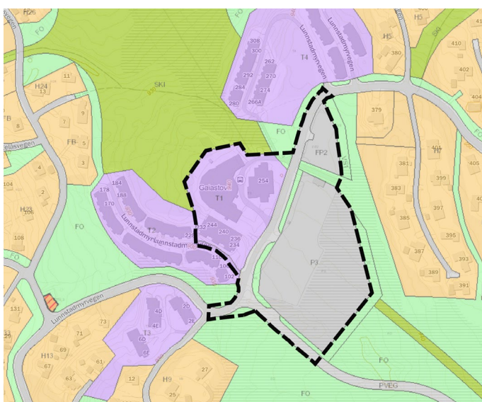
Utsnitt av reguleringsplaner i området. Plangrense for Hafjell 950 vist med sort-stiplet linje.