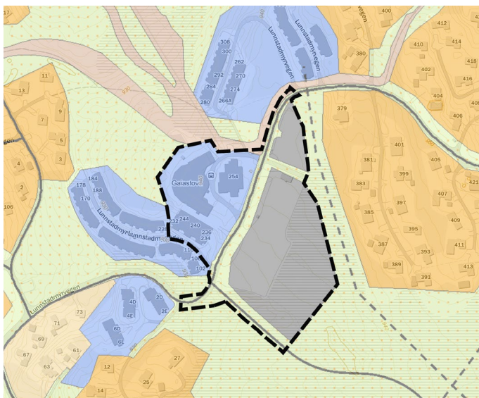
Utsnitt av kommunedelplan for Øyer Sør. Plangrense for Hafjell 950 vist med sort-stiplet linje.

Gjeldende kommunedelplan ble vedtatt i 31.5.2007. Det aktuelle byggeområdet er avsatt til nåværende næringsareal og parkering. Kommunedelplanen er under revisjon.