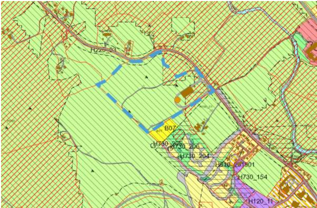
FIGUR 6 PLANOMRÅDET MED KPA I BAKGRUNN

I kommuneplanens arealdel er området avsatt til LNF sikringszone 190 – værradar. Videre er deler av planområdet dekket av fareområde flom. Flomfaren i KPA samsvarer ikke med NVE sine registreringer.