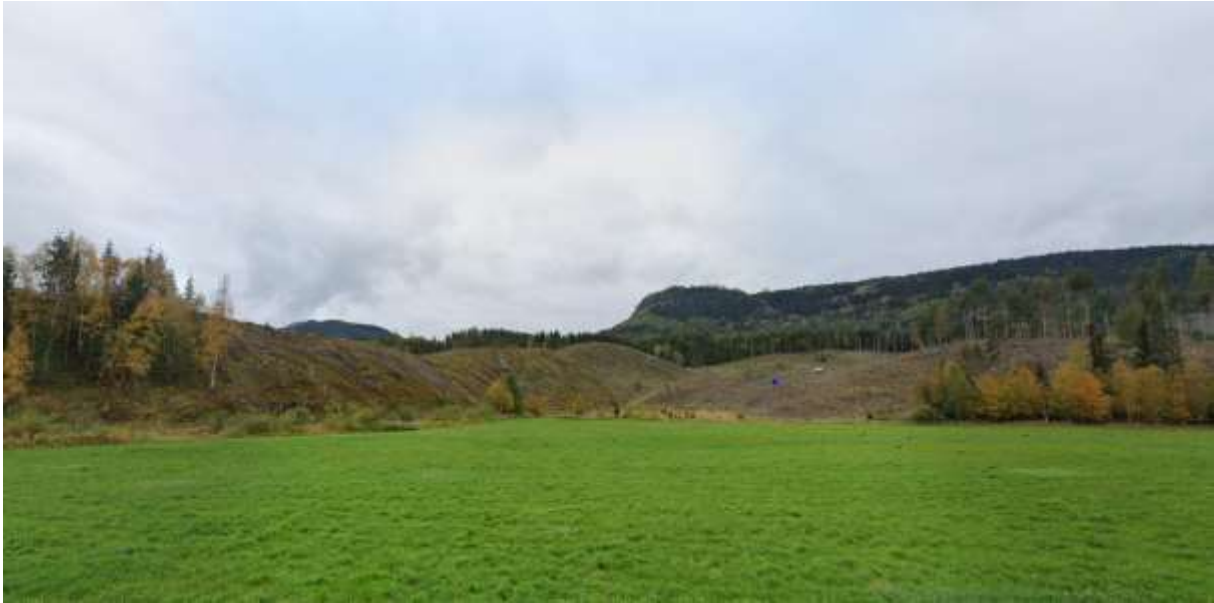
FIGUR 4 PLANOMRÅDET. AKTUELLE DEPONERINGSAREALER SEES I BAKGRUNN