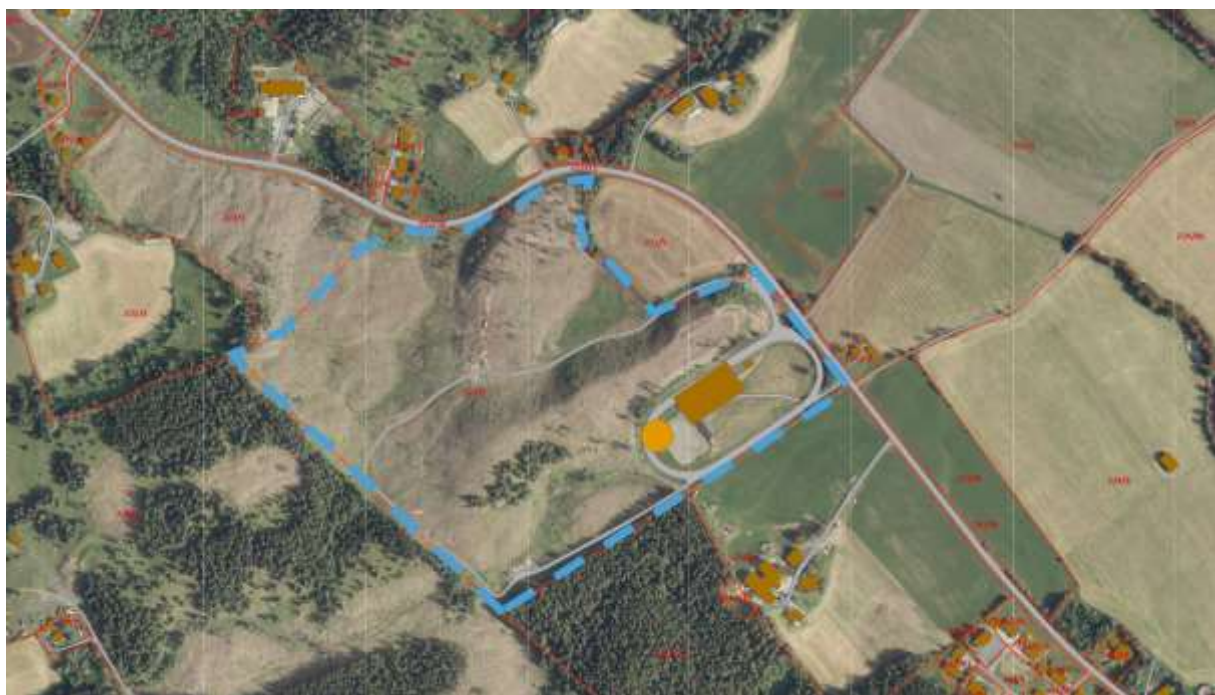
FIGUR 2 ORTOFOTO