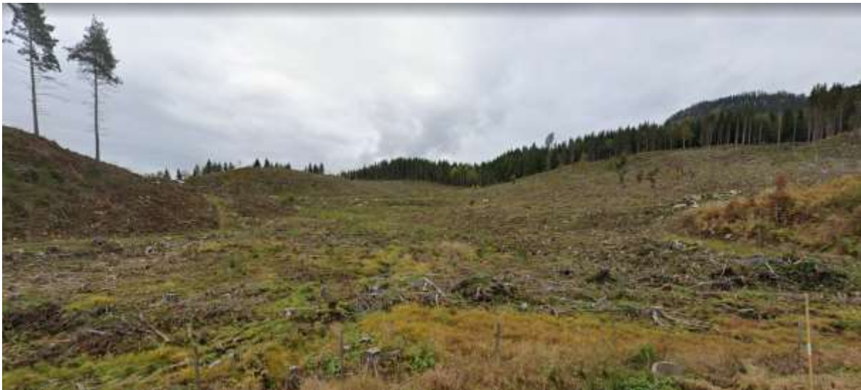
FIGUR 5 PLANOMRÅDET