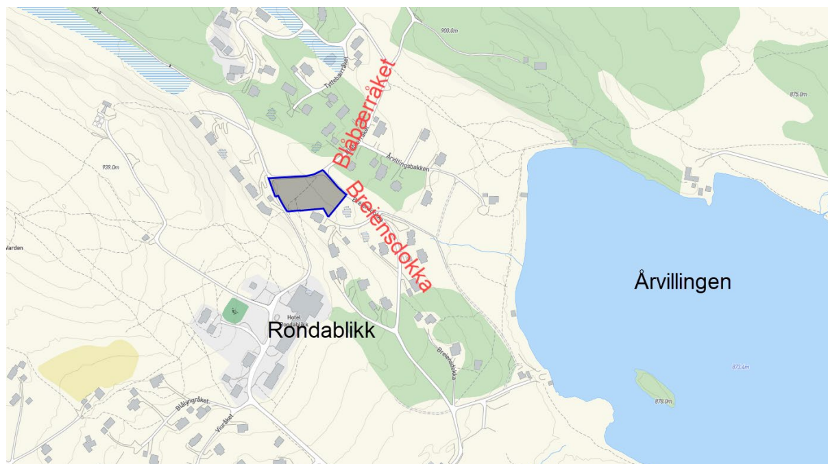
Illustrasjon1: Oversiktskart/ planavgrensning

Planområdet er på ca. 3,5 dekar og skal tilrettelegges for fritidsbebyggelse. I tillegg til fritidsbebyggelse tar planforslaget også for seg veiadkomster, tilhørende friluftsområder og teknisk infrastruktur. Planområdet grenser til og erstatter deler av eksisterende reguleringsplan for Kvamsfjellet nærings- og hytteområde. Reguleringsplanen grenser til Breiendsokka og Blåbærråket og ligger til nord for Rondablikk Hotell, samt vest for Årvillingen.