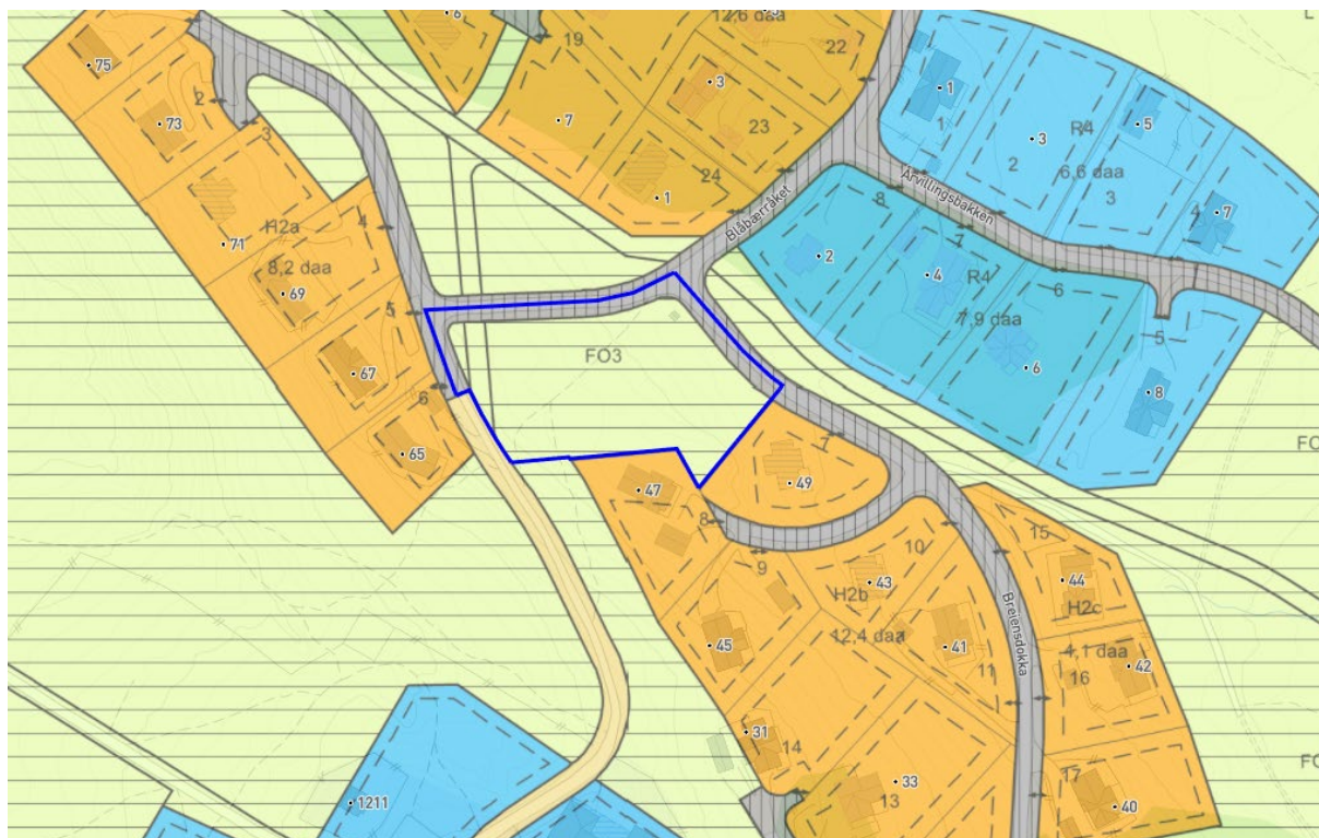
Illustrasjon 2: Utsnitt av gjeldende reguleringsplan i området.