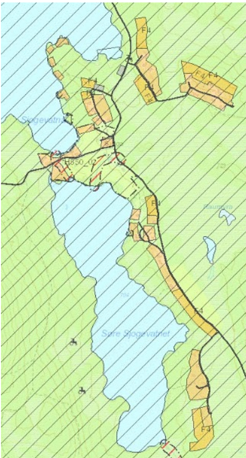
F4-feltene i kommuneplanens arealdel