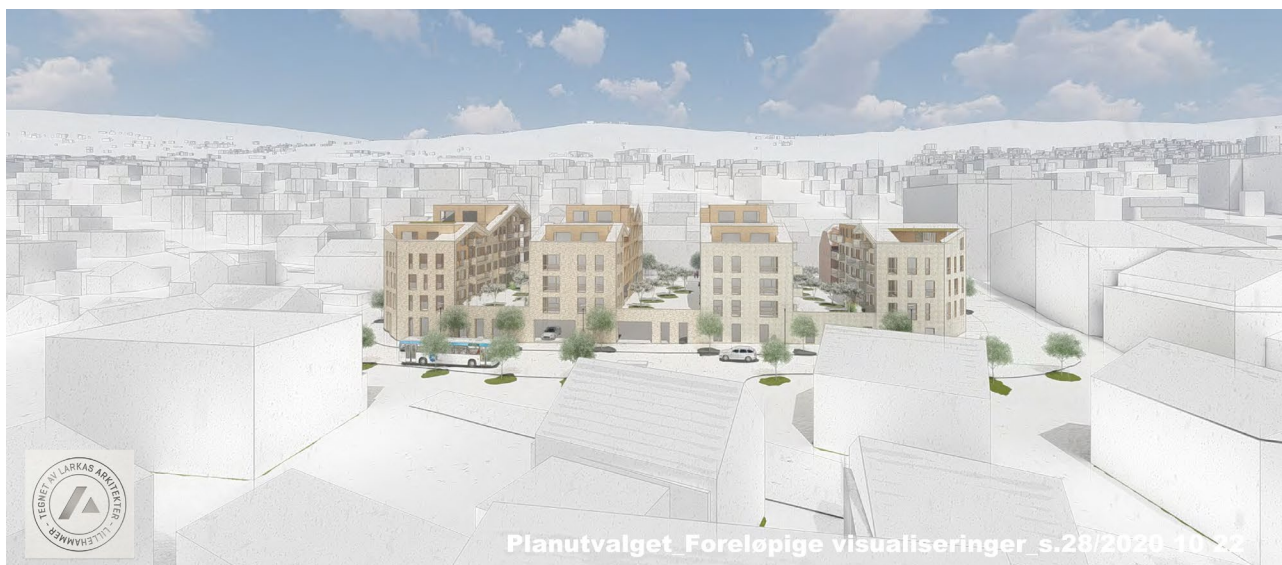
Foreløpig visualisering – mulighetsstudie. Tegnet av Larkas Arkitekter

I forbindelse med oppstart av planarbeidet er det utarbeidet skisser for mulig utbygging. Skissene viser blant annet forretning i sokkeletasje / gateplan Nordsetervegen samt lamellbebyggelse i fire etasjer med en inntrukket femte etasje – målt fra gateplan. Areal for felles uteopphold og lek er planlagt integrert i kvartalet.