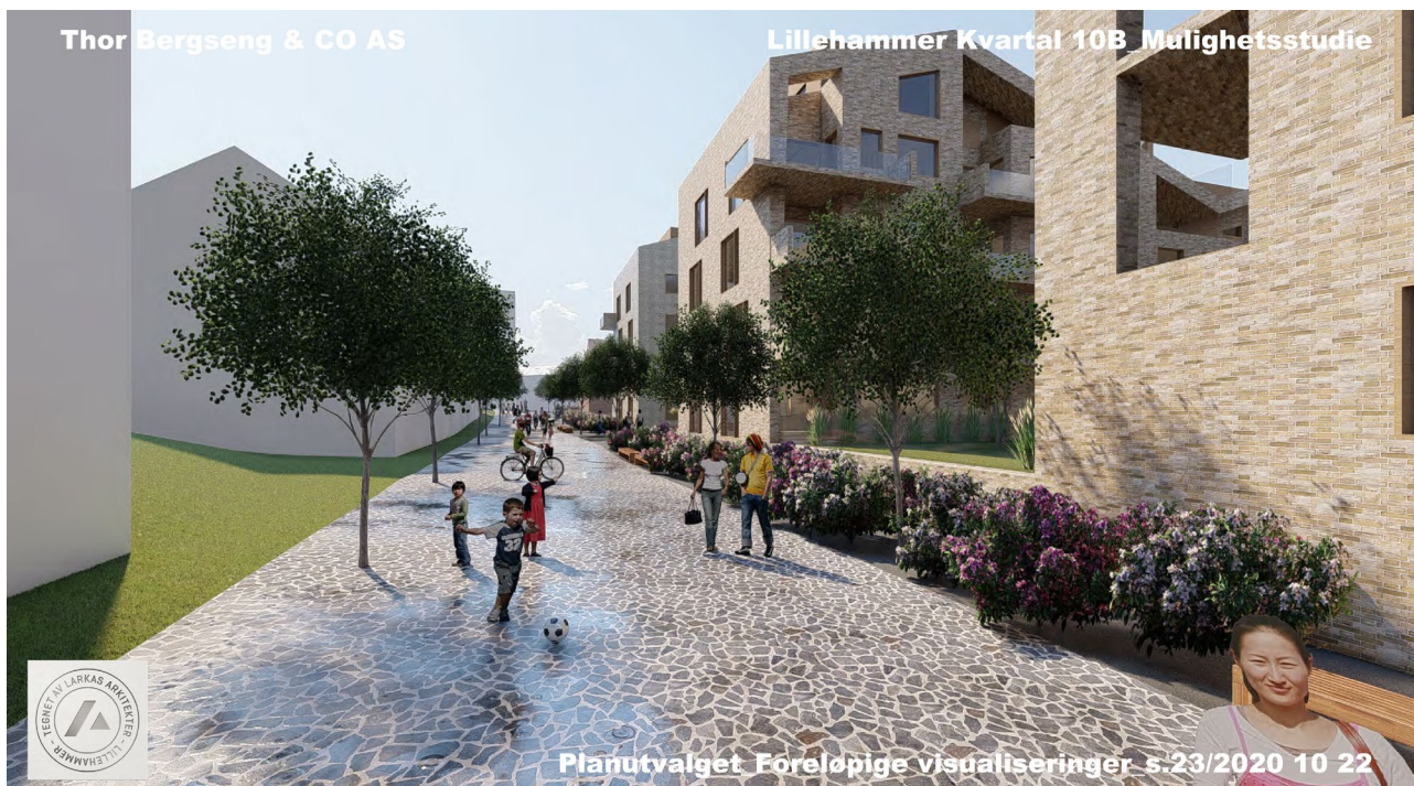
Foreløpig visualisering av miljøgate i Lars Skrefsrudsgate – sett fra Tomtegata mot sør.

Planforslaget vil søke å etablere Lars Skrefsrudsgate som miljøgate, men fortsatt tillatt for kjøring til eiendommene bak. Formålet med miljøgate er å stimulere til at Lars Skrefsruds gate blir en attraktiv forbindelse for gående og syklende nordover fra Mesnakvartalet. Planforslaget vil vurdere løsninger i Lars Skrefsruds gate som sikrer trafikkavvikling på myke trafikanters premisser.