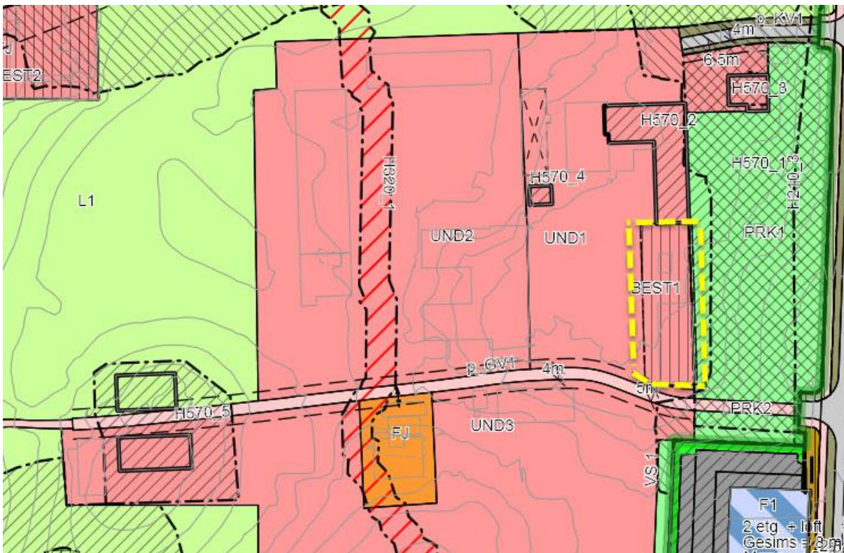
Utsnitt av Områderegulering for Valle med planområde for detaljregulering markert.

I områdereguleringens bestemmelser er det satt krav om at detaljregulering skal avklare både permanente og midlertidige bygge- og – og anleggstiltak. Det er også krav om at nybygg skal ha høy arkitektonisk kvalitet. Områdereguleringen vil fremdeles være gjeldende, men det vil bli gitt supplerende bestemmelser for detaljreguleringen.