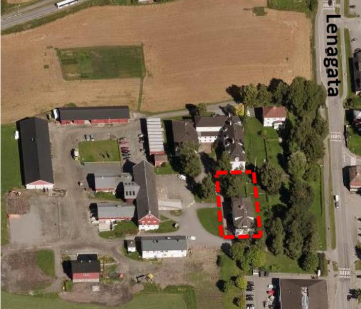
Flyfoto som viser eksisterende situasjon.

Planområdet omfatter et mindre areal innenfor arealene til Lena-Valle videregående skole - avdeling Valle. Planavgrensning følger i hovedsak grense for bestemmelsesområde i Områderegulering for Valle , men har fått en liten utvidelse mot øst og vest for å sikre nok areal under byggeperioden. Det understrekes at byggelinje skal følge fasaden på dagens internatbygg.