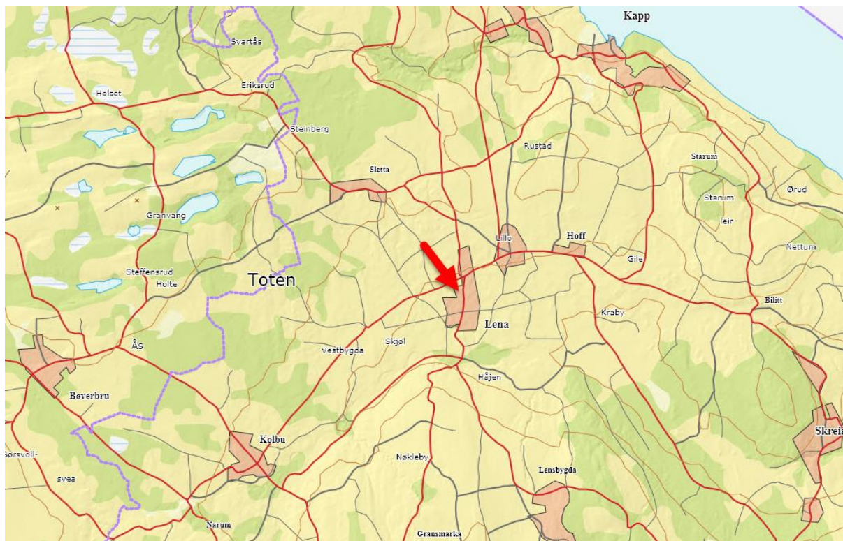
Planområdets beliggenhet markert i oversiktskart.